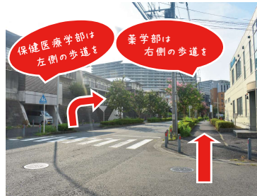
⑧ 薬学部棟はそのまま直進してください。保健医療学部棟へは横断歩道を渡り、左側の歩道を直進してください。