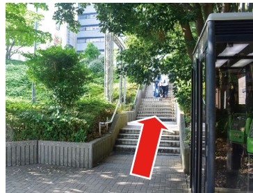
③ 階段を上がります。