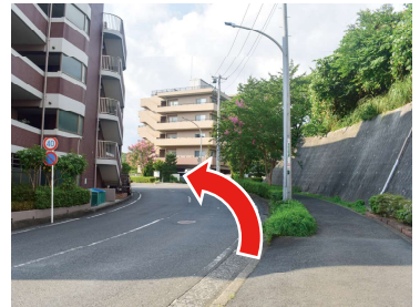
⑦ 道なりに進みます。（カーブの先は高架橋になっています）