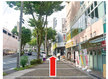
⑤ 直進します。（緩やかな坂道です）