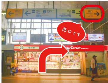
① 東戸塚駅改札を出て、右（西口）に進みます。