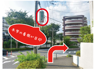
⑥ 信号の先の郵便局を過ぎると曲がり角がありますので、右に曲がります。（横断歩道は渡らないでください）