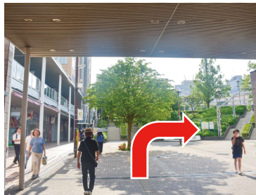
② 駅を出て右に進みます。