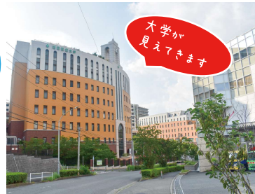
⑨ 前方に大学が見えてきます。

大学には駐車場がありません。車でお越しの際は、駅周辺のコインパーキング等（有料）をご利用ください。