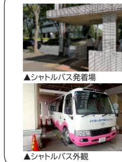
▲シャトルバス発着場