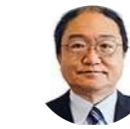
栗原 正明 教授